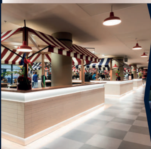
SALON DES LUMIÈRES

CHOISISSEZ LA PRESTATION QUI VOUS CONVIENT