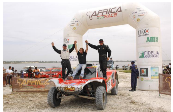
Africa Race 2011